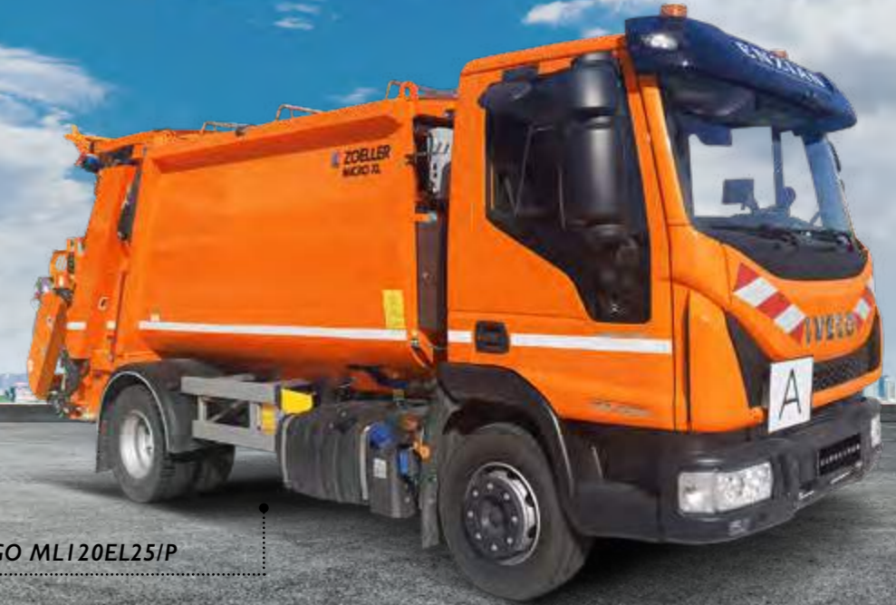
EUROCARGO MLI 20EL25IP