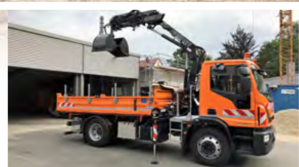
Machen Sie mehr drauf: Hinterachslasten von bis zu 12 t ermöglichen eine einsetzgerechte Beladung der Kippbrücke.