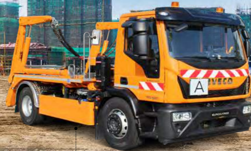
EUROCARGO MLI 80E28/FP