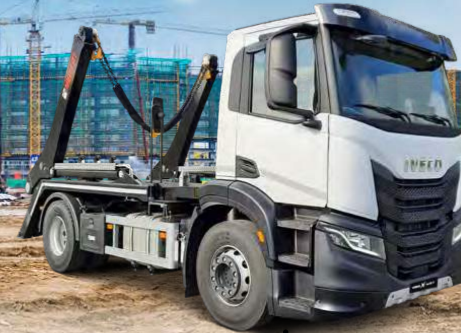
X-WAY AD200X36/P ON

Kein Platz da? Mit seinen kompakten Maßen und den kurzen, aufbauspezifischen Radständen von 3.105 bis 3.690 mm bringt der Eurocargo Sie dorthin, wo andere Fahrzeuge nicht weiterkommen. Die leistungsstarken und strapazierfähigen getriebeseitigen Nebenabtriebe mit bis zu 1.000 Nm Drehmoment sorgen dabei immer für die richtige Power. Doch nicht nur als Solofahrzeug ist der Eurocargo eine Wucht: Auch beim Anhängereinsatz zeigt er, was die Verbindung aus durchzugsstarkem Reihensechszylindermotor mit 235 kW (320 PS) und automatisiertem 12-Gang-Getriebe alles kann.