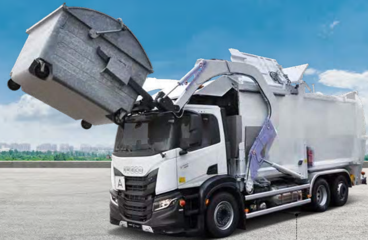
S-WAY AD260S40Y/PS 2LNG