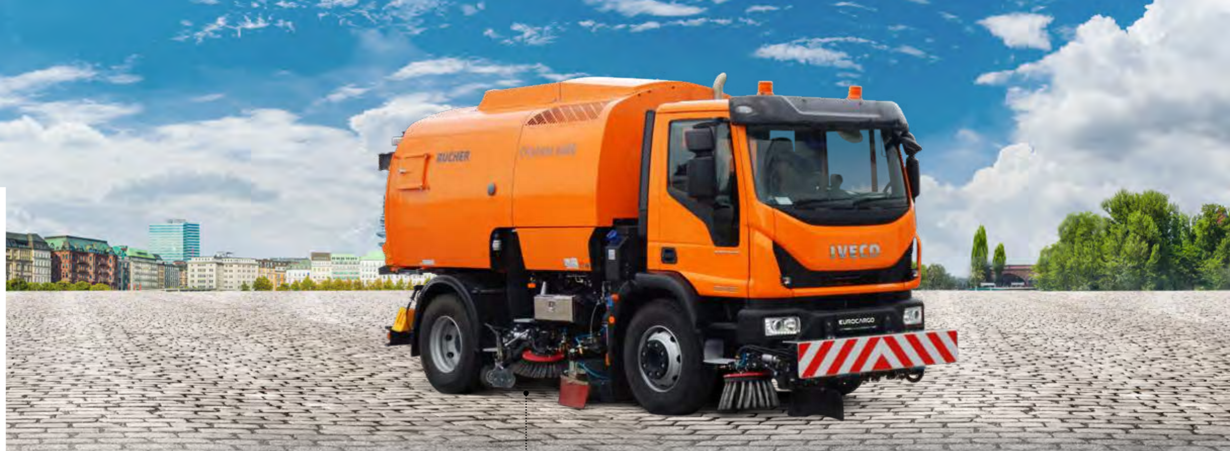
EUROCARGO MLI 60E28/P

Unten: Die Fahrgestellkomponenten befinden sich platzsparend an der linken Rahmenseite: perfekt für die rechtskehrende Ausführung.