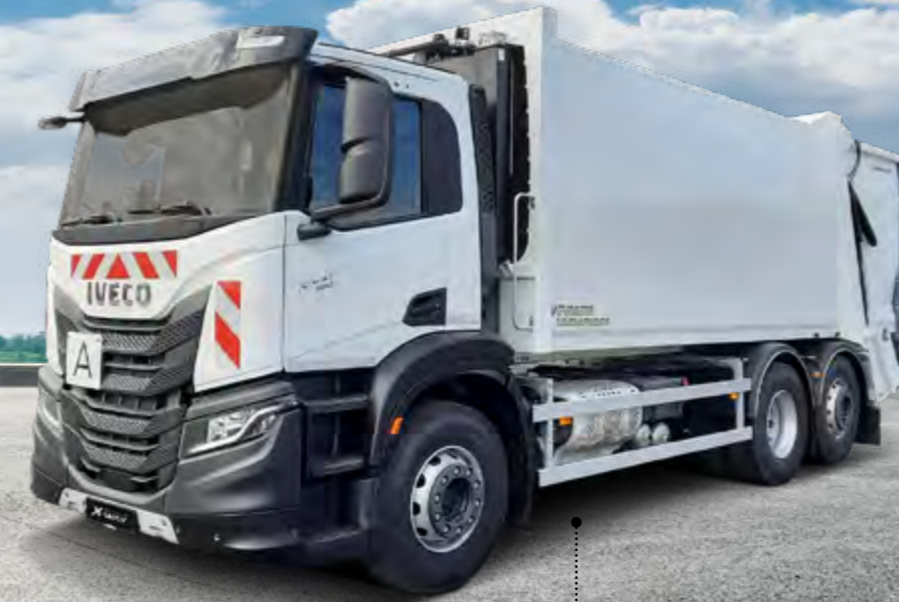
X-WAY AD280X36Y/PS ON