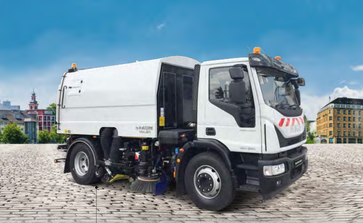
EUROCARGO MLI 60E25/P