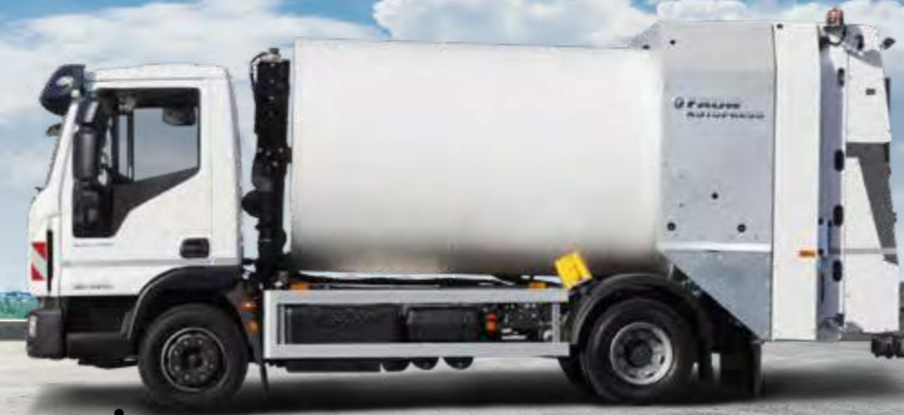
EUROCARGO MLI 20EL22IP