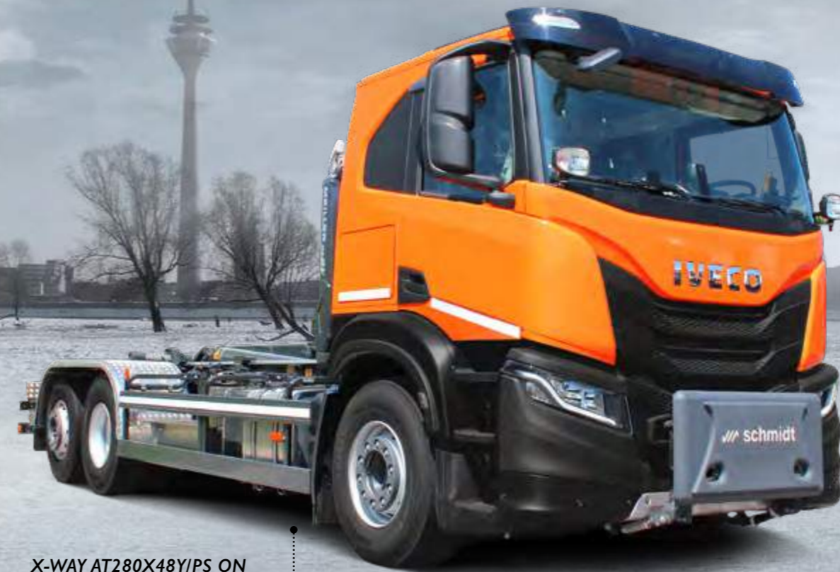
X-WAY AT280X48Y/PS ON