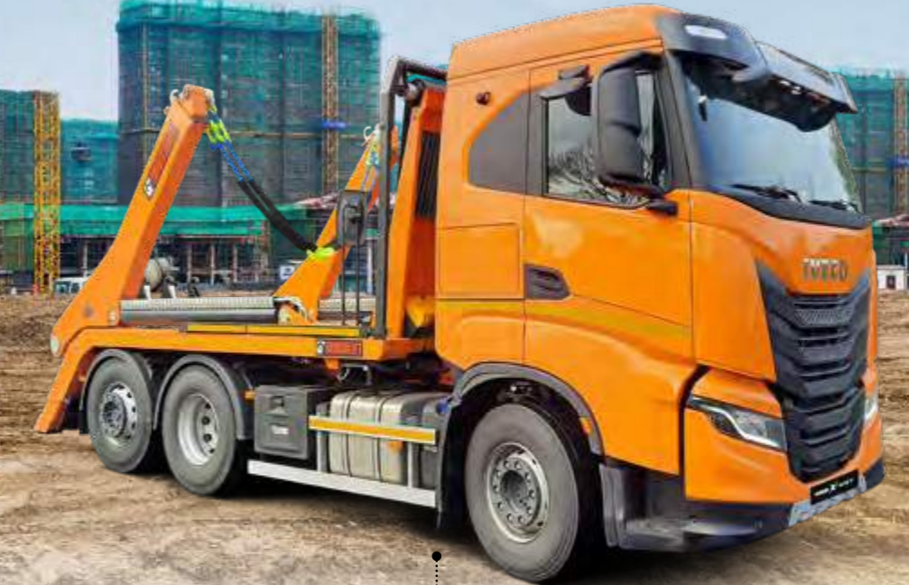
X-WAY AS280X49Y/PS ON

Kunststoff oder Stahl? Egal! Der dreiteilige Hybridstoßfänger ist in jedem Fall besonders wartungsfreundlich, denn die einzelnen Komponenten lassen sich im Schadensfall einfach und kosteneffizient austauschen . Auch in der kalten Jahreszeit können Sie auf den X-WAY bauen: In Kombination mit Kommunalhydraulik und Schneepflugaufbauplatte ist er bestens für den saisonalen Winterdienstesatz gerüstet .